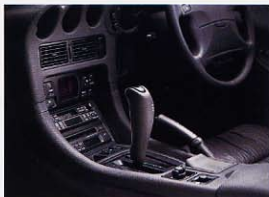
●ホールドモード付3モードELC-M 4A/T

GTO特別限定車 ●特別装備:専用ボディ色/ダラストップ/専用ダークグレー塗装アルミホイール/前席本革シート(GTOマーク入)/CDプレーヤ付AM・FM電子同調ラジオ&カセット(6スピーカー)/VCU式リヤリミテッドスリップコントロール/電子制御サスペンション(ECS) ●主要装備・機能:リヤスポイラ(ハイマウントストップランプ付)/運転席8WAYスポーツシート/マイコン式フルオートエアコン/SRSエアバッグシステム/4輪アンチロックブレーキングシステム(ABS)/車速・操舵力感応型4輪操舵(4WS)/サイドアビーム