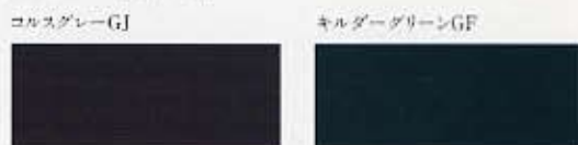
●内装基調色は全車ダークグリーン ●色見本は印刷インキの性質上、実際の色と異なって見えることがあります。