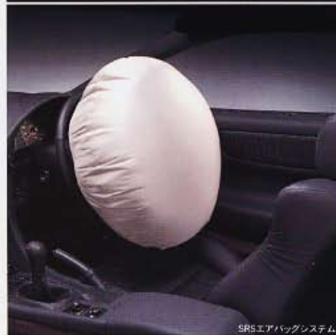
SRSエアバッグシステム

SRSシートベルト補助防衝突乗員保護装置 (シートベルト補助装置であり、シートベルト着用が前提となります。)