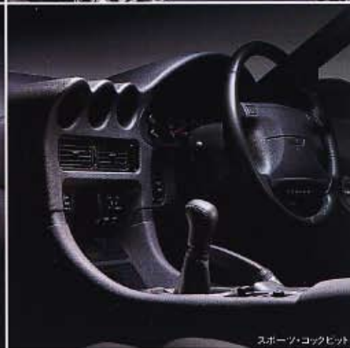
スポーツ・コックピット

SRSシートベルト補助防衝突乗員保護装置 (シートベルト補助装置であり、シートベルト着用が前提となります。)