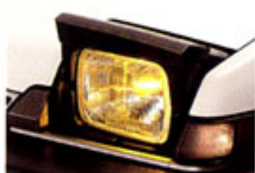
イエローバルブ・ハロゲン ヘッドライト

日本でただ1社、ホンダだけが挑み続け、そして勝ちとったF-1世界チャンピオン。 いま、この栄光を記念して、アコード2.0Si特別仕様車をお届けします。 F-1テクノロジーが生んだHONDA DOHCパワーに 魅力あふれる特別装備をプラス。ホンダの熱いハートを伝える一台です。