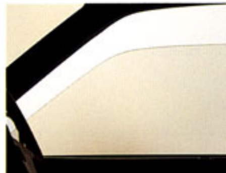
全面ブロンズガラス

ステアリングホイール F-1エンブレム F-1スペシャル・エディションを象徴するエンブレム。ハンドルを握るたびに誇りを伝えます。