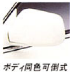
ボディ同色可倒式 電動リモコンドア ミラー

195/60 14インチスチールラジアルタイヤ +メッシュタイプ・アルミホイール(14インチ) 2.0ℓDOHCパワーの走りをいっそうきわだたせる高性能タイヤと、スポーティなムードを高める1ピースの軽量アルミホイールです。