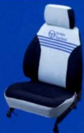
●シートカバー (セルジオ・タッキーニ/グレー)