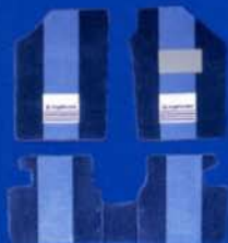
●カーペットマット (セルジオ・タッキーニ/グレー)