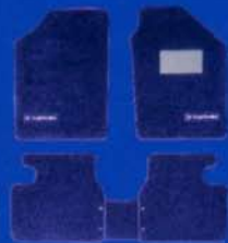
●カーペットマット (セルジオ・タッキーニ/ブルー)