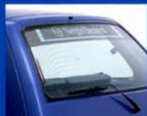
●リヤサンシールド (セルジオ・タッキーニ)