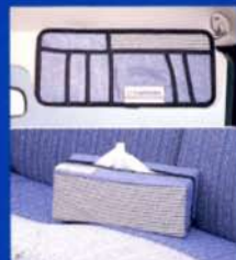
●ファンシーセット (セルジオ・タッキーニ)