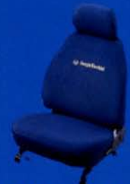
●シートカバー (セルジオ・タッキーニ/ブルー)