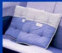
●クッションセット (セルジオ・タッキーニ)