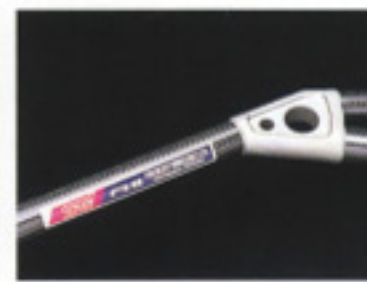
フロントカーボンストラットタワーバー