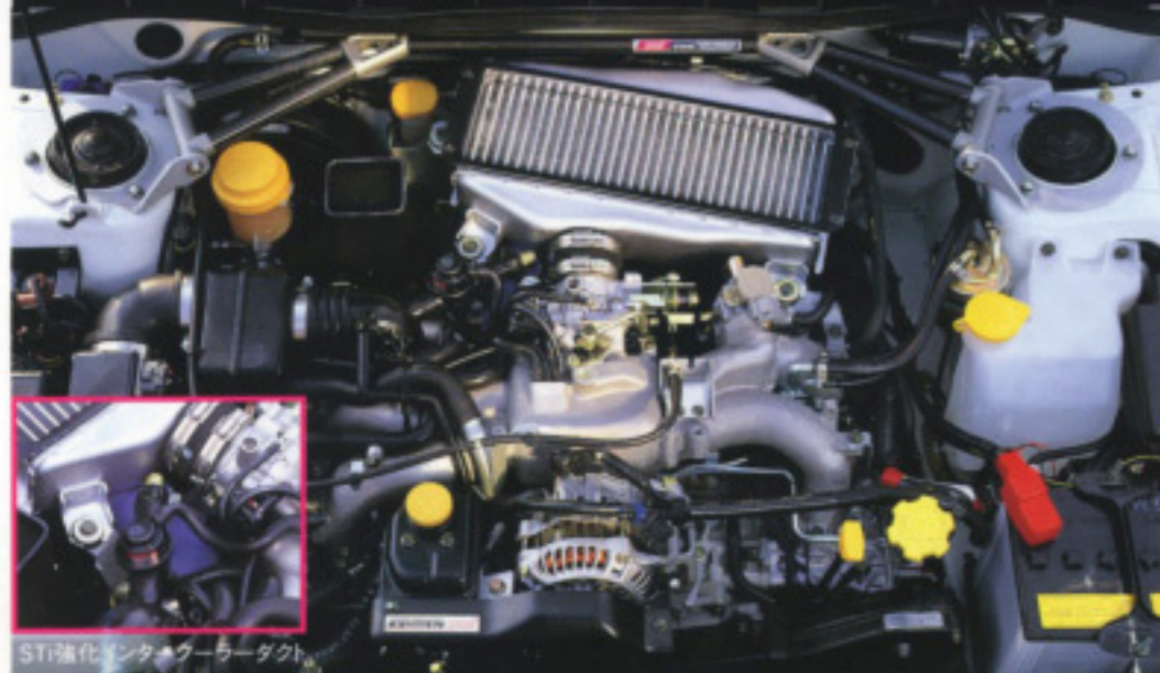
STi強化インタークーラーダクト

EJ20=BOXER 4cam 16valve TURBOCHARGER with INTERCOOLER MAXIMUM POWER:275ps/6500rpm MAXIMUM TORQUE:32.5kg-m/4000rpm