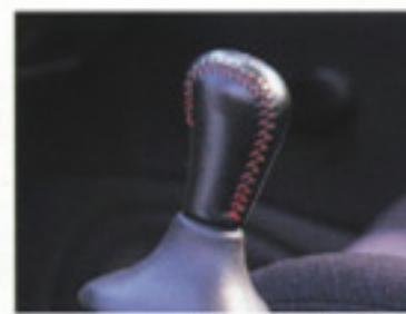
本革巻ショートタイプシフトノブ