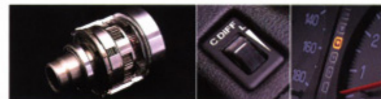
センターデフユニット