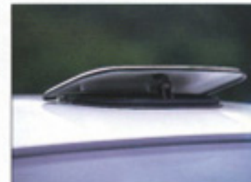
WRCタイプブルーベンチレーター

すべてのスポーツドライバーのために、走りの性能とテイストを高めるスペシャルアイテムを満載。