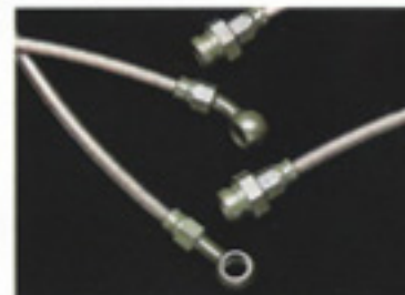
STi/アールズ・ステンレスメッシュブレーキホース